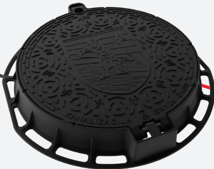
KANALSKI POKROV IN OKVIR Ø600, (OKROGLI) D400, SIST EN 124

Protihrupni vložek, dvojni simetrični zaklep, brez ventilacijskih odprtin.